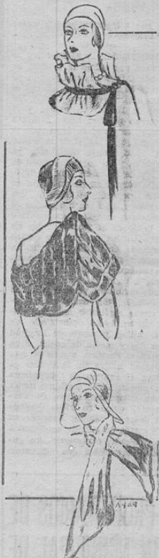
Las pieles serán siempre indispensables para la mujer elegante. Nótese la originalidad de los modelos, principalmente el superior y el inferior, que son especialmente para abrigo de la ganta.