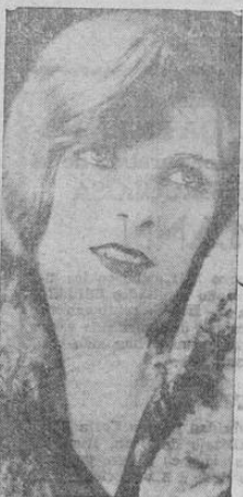
Blanche Sweet, la hermosa artista que tan merecida simpatía goza por su arte y su gracia