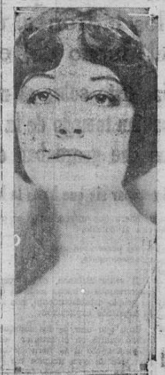
Paulina Fréderick, la hermosa artista de cine, que tantos admiradores ha conquistado por su arte y su belleza.

SURTIDO COMPLETO DE JAULAS DORADAS, comederos y bañaderos para toda clase de jaulas Ferretería ALVAREZ y Co. Costado Sur Club Unión