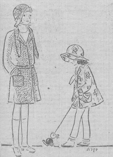
A la izquierda vemos un modelo de paño, para niña. El sombrero hace juego con la capa, siendo del mismo material. A la derecha, capita para niño