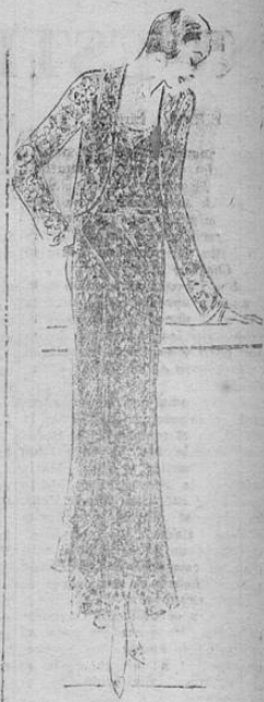
Atrayente modelo de líneas largas, con una línea corta en el bolero