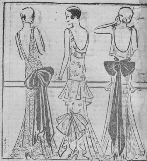
A pesar de los cambios de la moda, el lazo continúa manteniendo su popularidad. Estos tres atrayentes modelos así lo indican. El del centro es un lazo bajo. Los otros dos van, el de la derecha en la cintura, y el de la izquierda, más abajo de la línea del talle