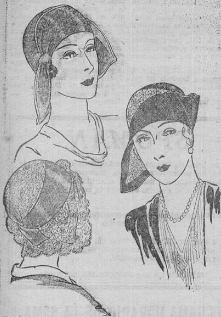
Toda mujer elegante conoce el atractivo del sombrero. Estos modelos ofrecen nuevas variedades que serán indudablemente bien apreciadas por nuestras lectoras